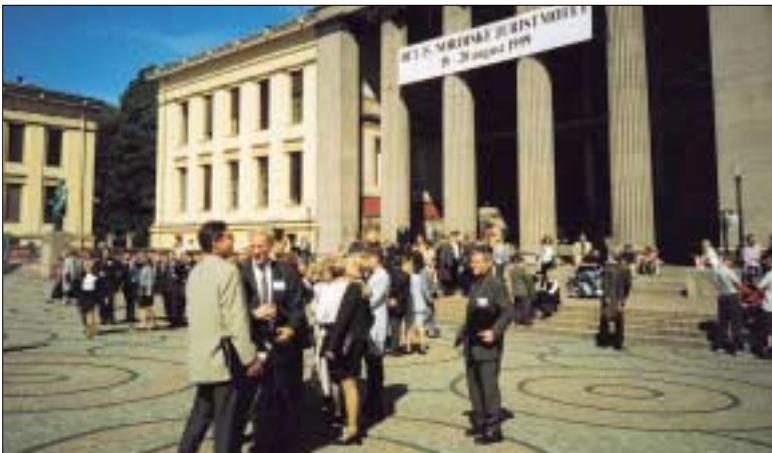
Fyrir utan þingstaðinn.

Hvað varðar félagsleg samskipti þátttakenda er þess að geta að fyrsta kvöldið bauð borgarstjóri Óslóborgar til móttöku í ráðhúsinu. Var það fjölmenn samkoma en það sem vakti mesta athygli undirritaðs var að þeir embættismenn borgarinnar sem vinna við það að áætla neyslu veislugesta, hvort sem um er að ræða fasta eða fljótandi fæðu, voru ekki starfi sínu vaxnir. Í stuttu máli sagt var slegist um þær matarörður sem sáust á borðum og voru það aðeins hinir huguðustu sem hættu sér nærri atganginum. Annað kvöldið var hin sívinsæla jafnræðisregla gróflega brotin á þátttakendum með því að fólki á besta aldri (yngra en 37) var boðið til bátsferðar og strandveislu á meðan eldri borgurum var boðið í heimasamsæti hjá hinum ýmsu