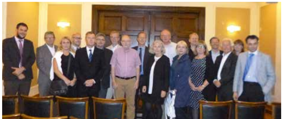
Móttökur hjá aþenska lögmannafélaginu voru höfðinglegar.