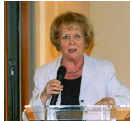
Frú Vigdís Finnbogadóttir.

FKL hefur allt frá stofnun félagsins átt í góðu samstarfi við Félag kvenna