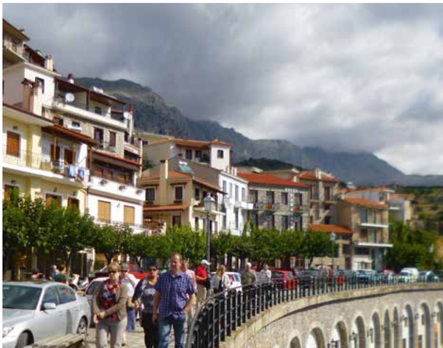
Á göngu í þorpinu Delfí sem var flutt um aldamótin 1900 þegar farið var að grafa upp fornminjar hins helga staðar.

ÞAÐ HAUSTAR AÐ. Prestirnir hópast á barina sem opnaðir eru á hverju hausti í reynitrijánnum og háma í sig gerjuð ber svo söngurinn hljómar eins og í vel heppnuðu kokkteilpartýi. Síðan flögga þeir í næsta tré, óstöðugir á stefnunni, og halda partýinu áfram. Á meðan á þessu stendur öndum við mennirnir að okkur gasi úr Holuhrauni og höfum áhyggjur af stöðu gjaldeyrismála, snjóhengjum, gjalddögum skuldabréfa og lekamálum. Öfundum þrestina af áhyggjulausu lífi. Því var það kærkomið þegar LMFÍ skipulagði lögmannnaferð til Aþenu dagana 22.–28. september síðastliðinn og bauð upp á sumarauka í þessari fornu menningarborg þar sem vagga siðmenningarinnar stóð. Við yfirgáfum dægurþrasið og skyggðumst aftur í söguna jafnframt því að kynnst lítillga Grikklandi dagsins í dag sem glímur við mörg sömu áhyggjuefnin og við hér uppi á Íslandi.