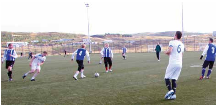
Allt var lagt í sölurnar á vellinum

Í leiknum um þriðja sætið milli LEX og LOGOS fór það að lokum svo að LEX fór með sigur af hólmi, 2-1. Úrslitaleikurinn milli OPUS og Járnsíðu