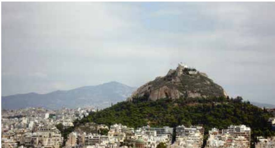
Aþenuborg var hrein og falleg.