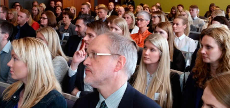
Pátttakendur málstofu voru 140 talsins.

einnig til hvers skattinn eigi að nota, en þau gamalkunnu stef má m.a. finna í svokölluðu „Auðlegðarskattmáli“ frá 10. apríl 2014. Þó má ljóst vera að eftir því sem skatthlutfallið er hærra, þeim mun líklegra er að dómstólar muni fallast á sjónarmið um ólögmæti skattsins.