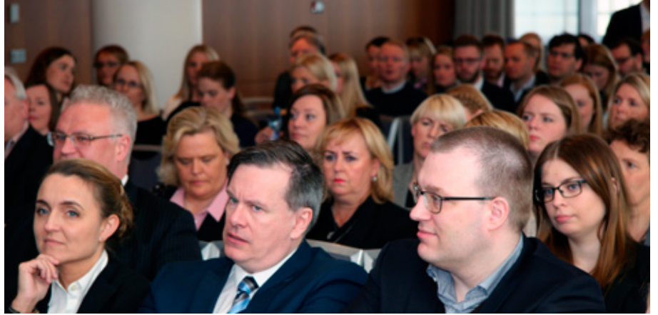
Rökstólarnir fyrir hádegi voru öllum opnir og mætti á þriðja hundrað manns.