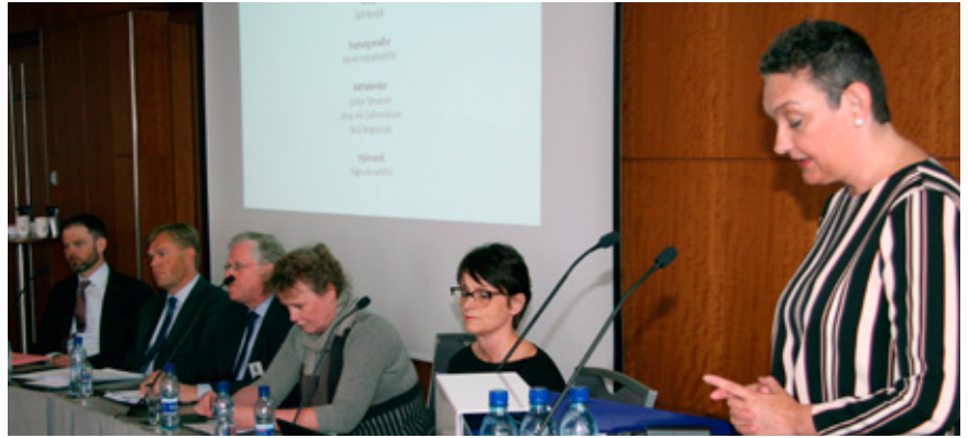
Ólöf Nordal innanríkisráðherra flutti ávarp.