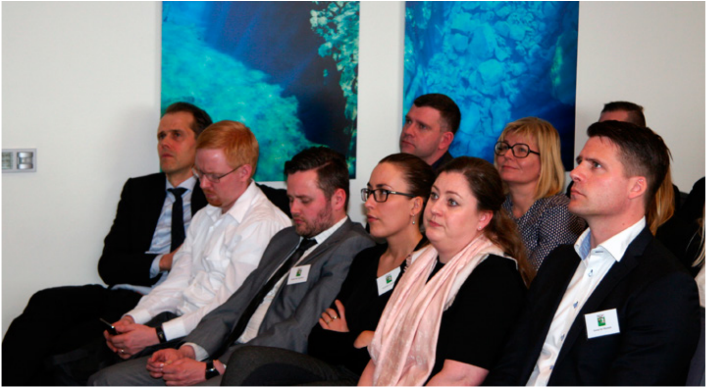
Málstofuna sátu um 70 manns.

til að taka bindandi ákvarðanir gagnvart íslenskum eftirlitsstofnunum og bindandi ákvarðanir sem bafa bein og íþyngjandi réttaráhrif gagnvart íslenskum fjármálaafyrirtækjum, er báð annmörkum með tilliti til íslensku stjórnarskrárinnar . Í þeim felst yfirþjóðlegt vald eftirlitsstofnana þar sem þátttökuréttur Íslands í ákvörðunum er ekki tryggður og ekki um gagnkvæmni að ræða varðandi réttindi og skyldur aðildarríkjanna eða aðila innan þeirra. Með innleiðingu gerðanna yrði stigið skrefi lengra í framsali framkvæmdarvalds og dómsvalds en áður hefur verið fallist á að rúmist innan 2. gr. stjórnarskrárinnar, enda samrýmist hugsanleg innleiðing reglugerðanna ekki fyrri viðmiðum um afmarkað framsal á ríkisvaldi á takmörkuðu sviði. Í ljósi þessa teljum við að framsalið rúmist ekki innan venjulegaðrar reglu um að almenna löggjafanum sé heimilt