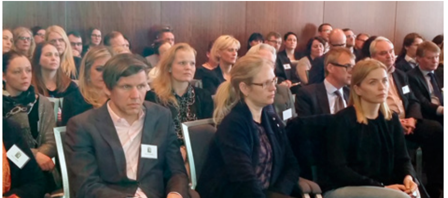
Málstofuna sátu 90 manns.