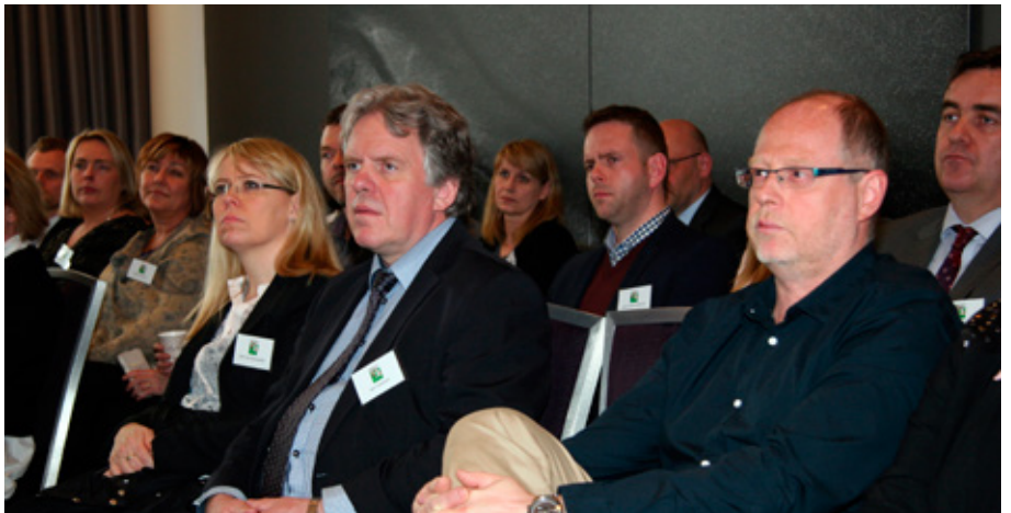
Þátttakendur málstofu voru 45.