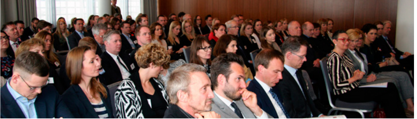
Málstofuna sátu 120 manns.