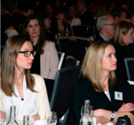
Aðalmálstofuna sátu um 470 manns.